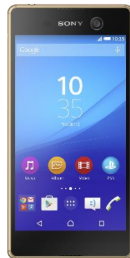
Sony XPERIA M5