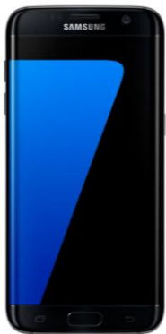
Samsung Galaxy S7 Edge