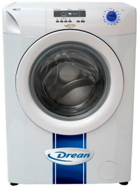
Whirlpool NEXT 6.08